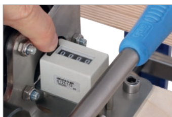
Azzerare il contatore