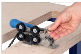
Infilare la catena. Posizionare la prima maglia sul perno del rivetto