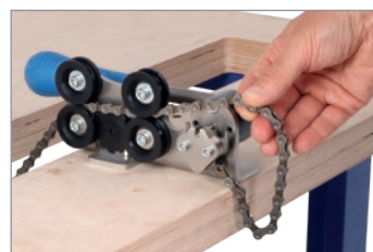
Appendere la catena al gancio Contare completamente la catena