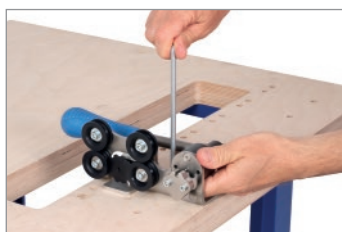
Fissare il tagliacatena sul banco di lavoro