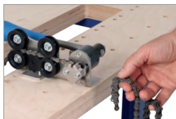
Rimuovere la catena