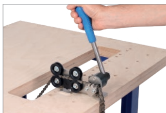
Tagliare la catena secondo la lunghezza. Premere il rivetto in modo completo. Se necessario, regolare di nuovo la vite di regolazione