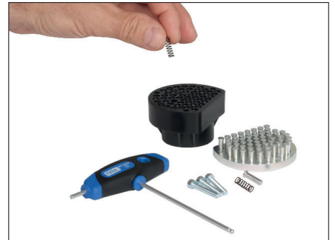
Defekte Stifte oder Federn austauschen. In umgekehrter Reihenfolge zusammenbauen.