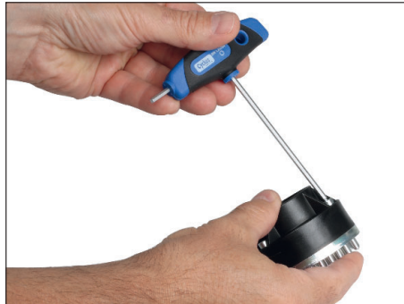
3x Schrauben lösen (Innensechskant 3 mm)