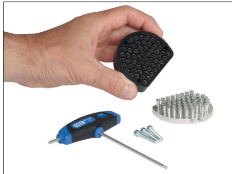
Stift- und Federeinheit ablegen.