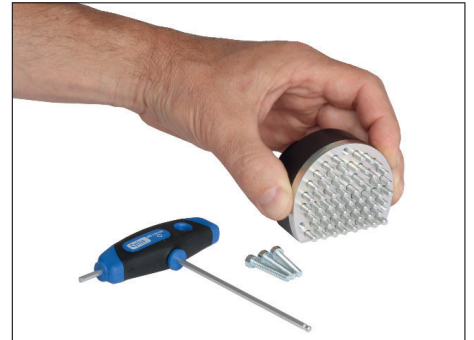
Achtung! Auf ebener Fläche absetzen. Nach links und rechts auseinander schieben. (Gefahr - Stifte und Federn können herausfallen)