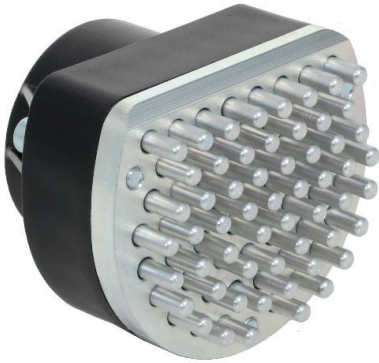
Steckadapter "Igel" 3D Universalklemmung passend für Worklift'r und Montageständer Art.-Nr. 290017