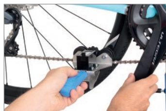
Dé una completa a la cadena