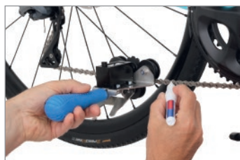
Segna la maglia della catena