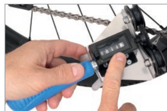
Leggi il numero delle maglie

Nota: Catene molto sporche possono compromettere il funzionamento del contatore delle maglie. Pulire il contatore delle maglie con un detergente per biciclette e una spazzola.