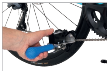
Imposta il contatore e azzera